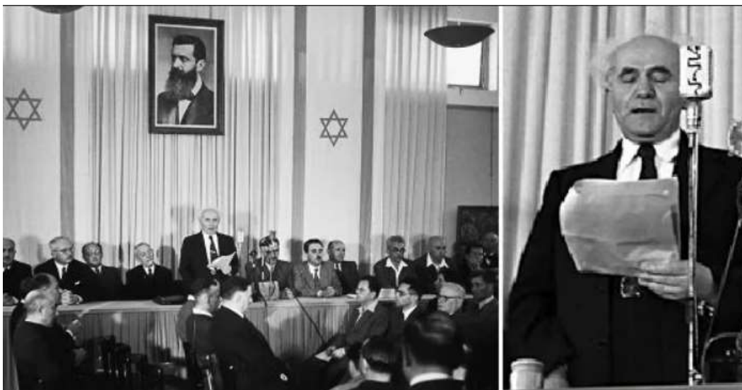
Давид Бен-Гурион провозглашает независимость Израиля (14 мая 1948)

1948 – Провозглашено создание государства Израиль