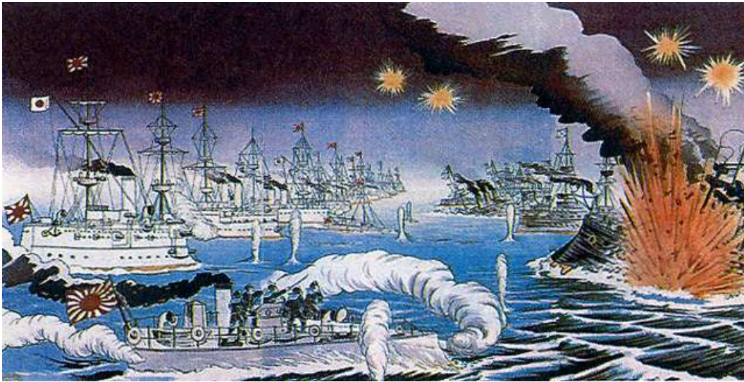
1905 – На Малаховом кургане в Севастополе открылась панорама «Оборона Севастополя» художника Ф. А. Рубо.